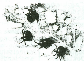
Elrehaantjes aan de maaltijd.